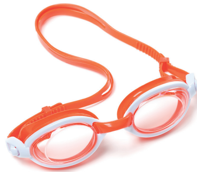
des lunettes de piscine