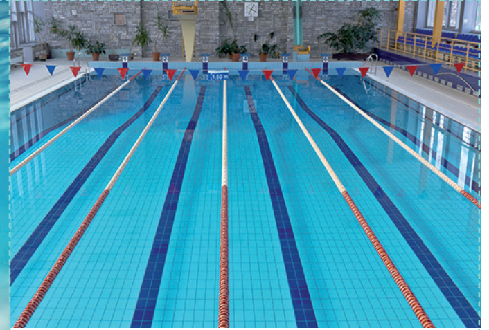
une piscine / un bassin