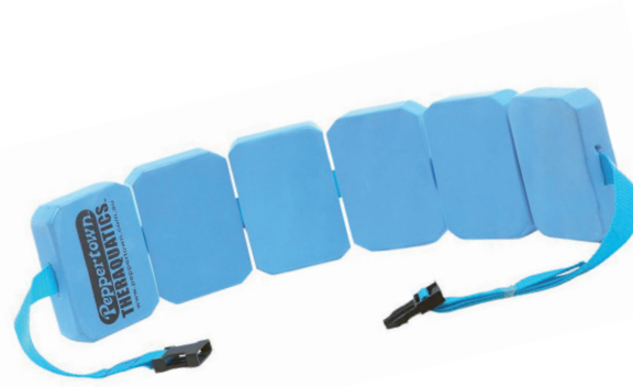
une ceinture bouée