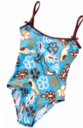
un maillot de bain