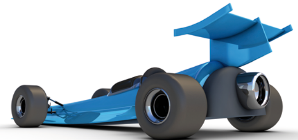
une voiture à réaction