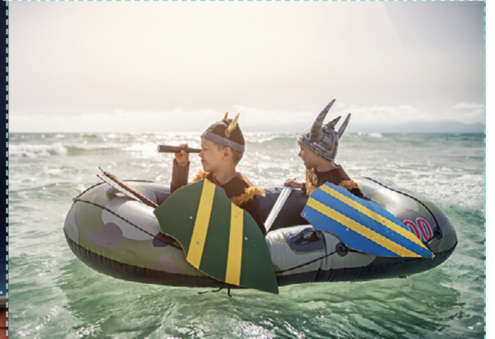
un explorateur, une exploratrice